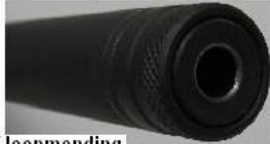
tromp of loopmondung

Als men dus vanaf de voorzijde reinigt heeft grote kans dat men met het handvat op de loopmondung botst, als men de stok niet recht houdt schraapt men met de volledig poetsstok langs de tromp.