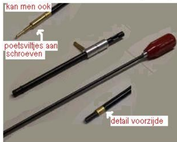
dewey poetsstok, met grendelgeleiding. Aan de voorkant zit schroefdraad voor hulpstukjes.

In geval van een grendelgeweer kun je het beste ook een geleiding gebruiken die men i.p.v de grendel plaatst.